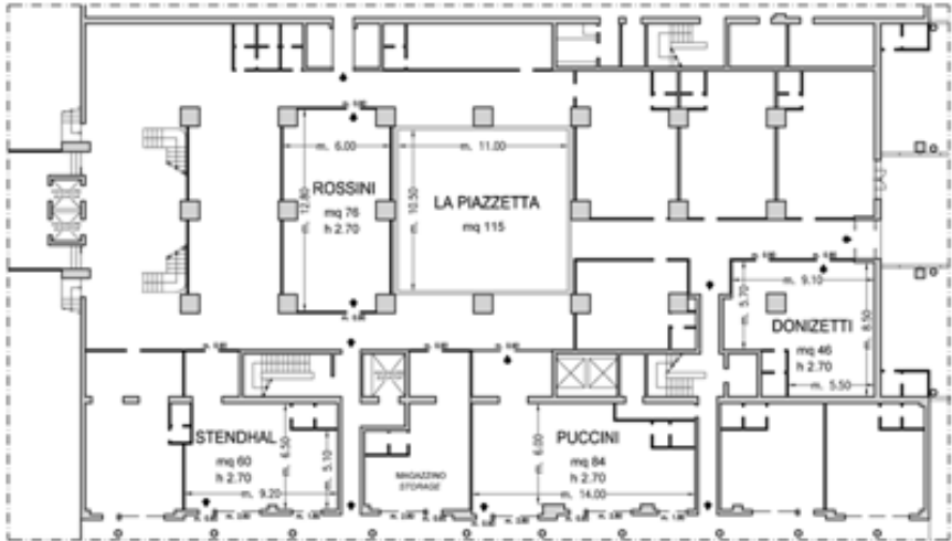
Piano -1 / Basement